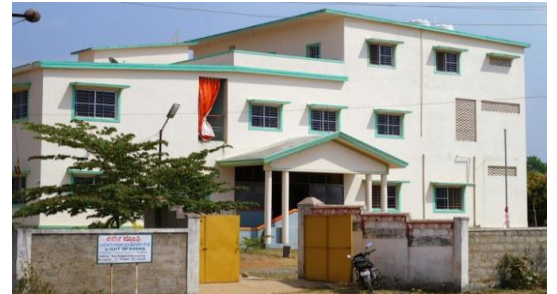
Centro Light of Karma

A lo largo del año 2009, tras valorar las necesidades de la zona rural de Mundgod, la ONG Estrella de la Mañana junto con la ONG Karma Foundation, plantean, la construcción de un centro residencial de formación profesional para estudiantes con discapacidad visual, con el propósito de garantizar por medio de una Formación Profesional, una educación de calidad adaptada a sus necesidades, mayor integración social y mejores oportunidades de vida a menores y jóvenes con déficits sensoriales y/u otras discapacidades, como la ceguera o baja visión.