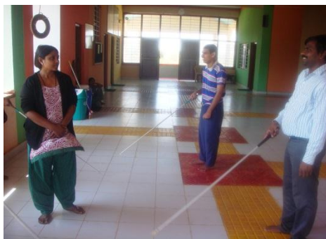
Taller de movilidad

Actualmente, Light of Karma es un centro totalmente adaptado a las necesidades de personas con discapacidad visual, situado en un terreno de aproximadamente 10.000 m, que ofrece gratuitamente alojamiento, manutención, cuidados médicos, material escolar, programas informáticos,